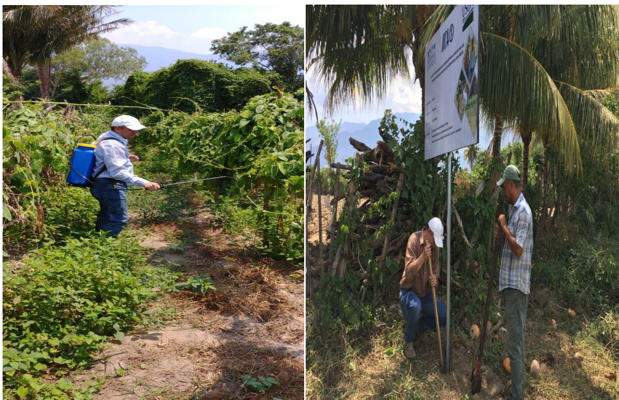
Figura 5. Identificación y rotulación de la parcela del señor Noé Sosa de aldea Chispan del municipio de Estanduela, Zacapa.