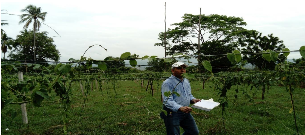
Figura 10. Recolección de datos en boletas de campo de parcelas de loroco en dos localidades del municipio de Chiquimula.