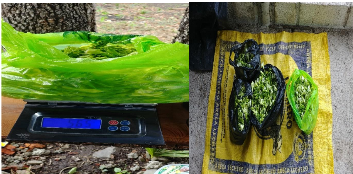
Figura 11. Corte y peso de la inflorescencia para obtener su peso en gramos, onzas, libras y/o kilogramos en una balanza digital en las parcelas de loroco de las cuatro localidades del municipio de Zacapa y Chiquimula.