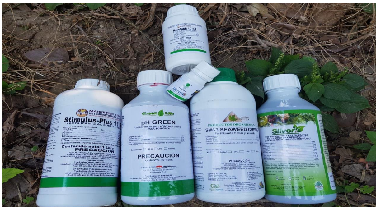
Figura 4. Productos de fitohormonas utilizados para aplicar en el cultivo de loroco en el proyecto de investigación, 2018.